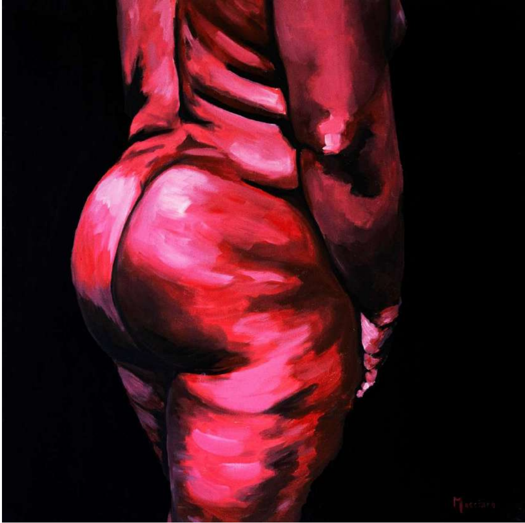
THE NEW EROS